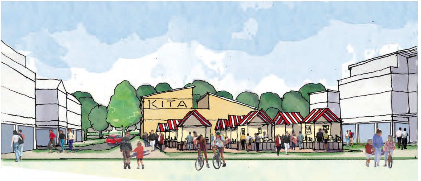
heyde-zentrum - Quartier der kurzen Wege