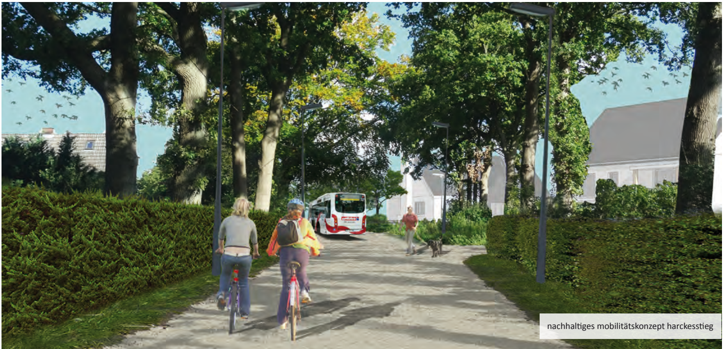
nachhaltiges mobilitätskonzept harcesstieg

© VZI und Amt für Stadtentwicklung, Umwelt und Verkehr